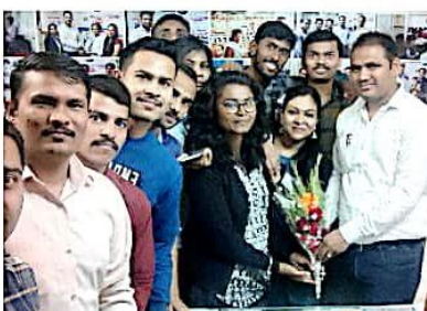
विद्यार्थ्यांचा सत्कार करताना देवरे सर