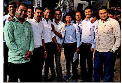
PSI पदी निवड झालेले विद्यार्थी