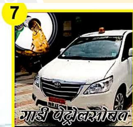
CAR With FUEL