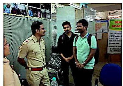
विद्यार्थ्यांशी संवाद साधतांना अधिकारी